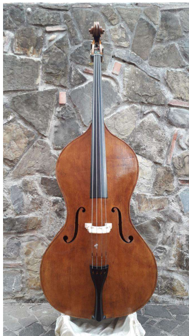
Contrabbasso G. Pierozzi acquistato dal Conservatorio di Milano nel 2021

In questo modo la classe si troverebbe dotata di 3 contrabbassi e di 1 bassetto funzionanti ed in perfetto stato.